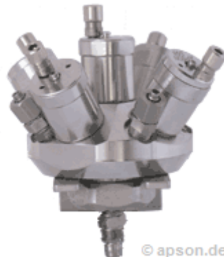
APSON 2K Schaltblock XMY-2010 ohne Rückführung

Dieser Schaltblock-Typ ist besonders geeignet zum Einsatz in automatischen Beschichtungs-Systemen mit oft zu wechselnden chemisch aggressiven Medien, z.B. Lacken, Härtern, Lösemitteln, Laugen, u.a. Er ist einsetzbar sowohl für 2K Uni-Lacke als auch 2K Metallic-Lacke.